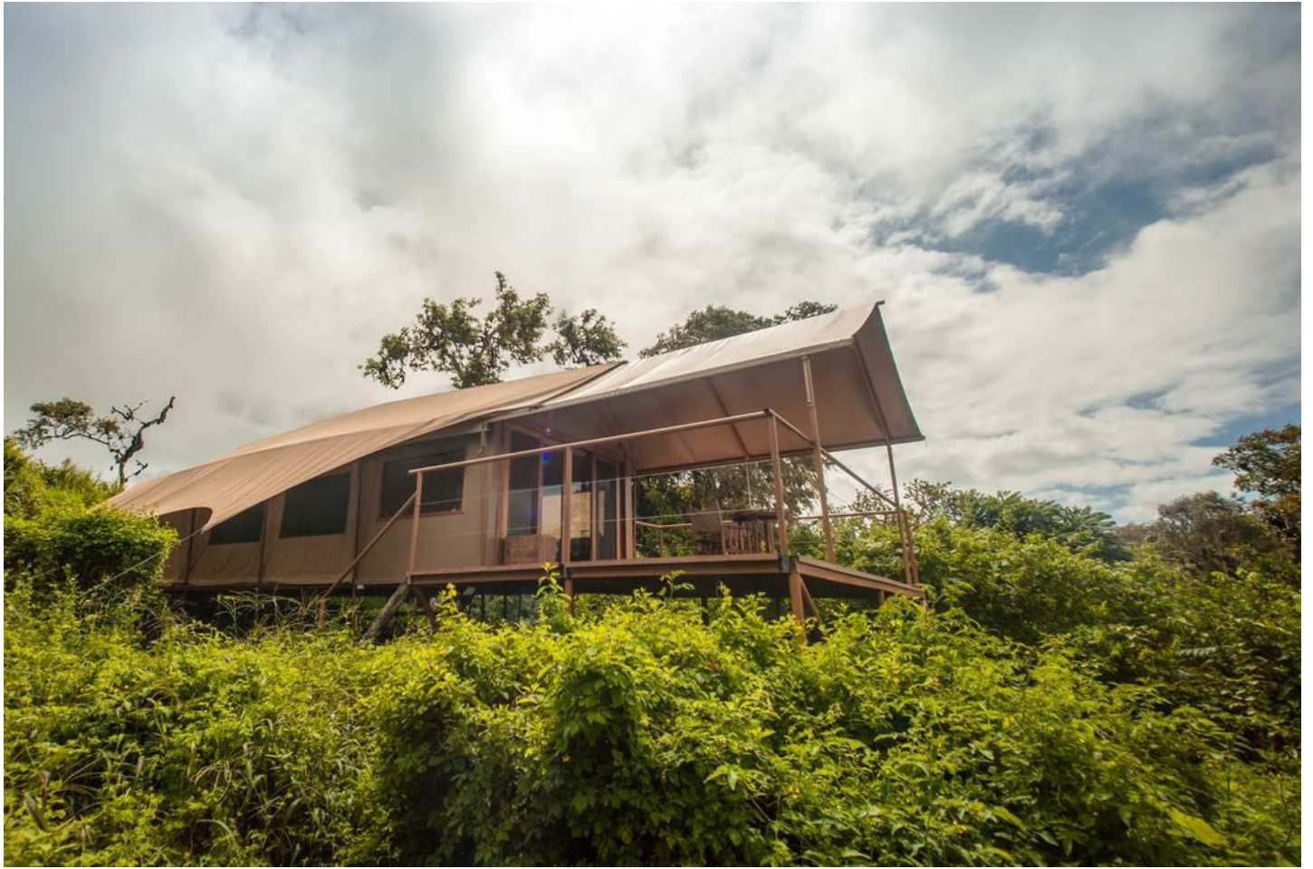
Santa Cruz Insel

Inspiriert durch die afrikanische Safari-Tradition, bieten die Zelte maximalen Komfort und vermitteln ein unvergleichliches Natur-Erlebnis.