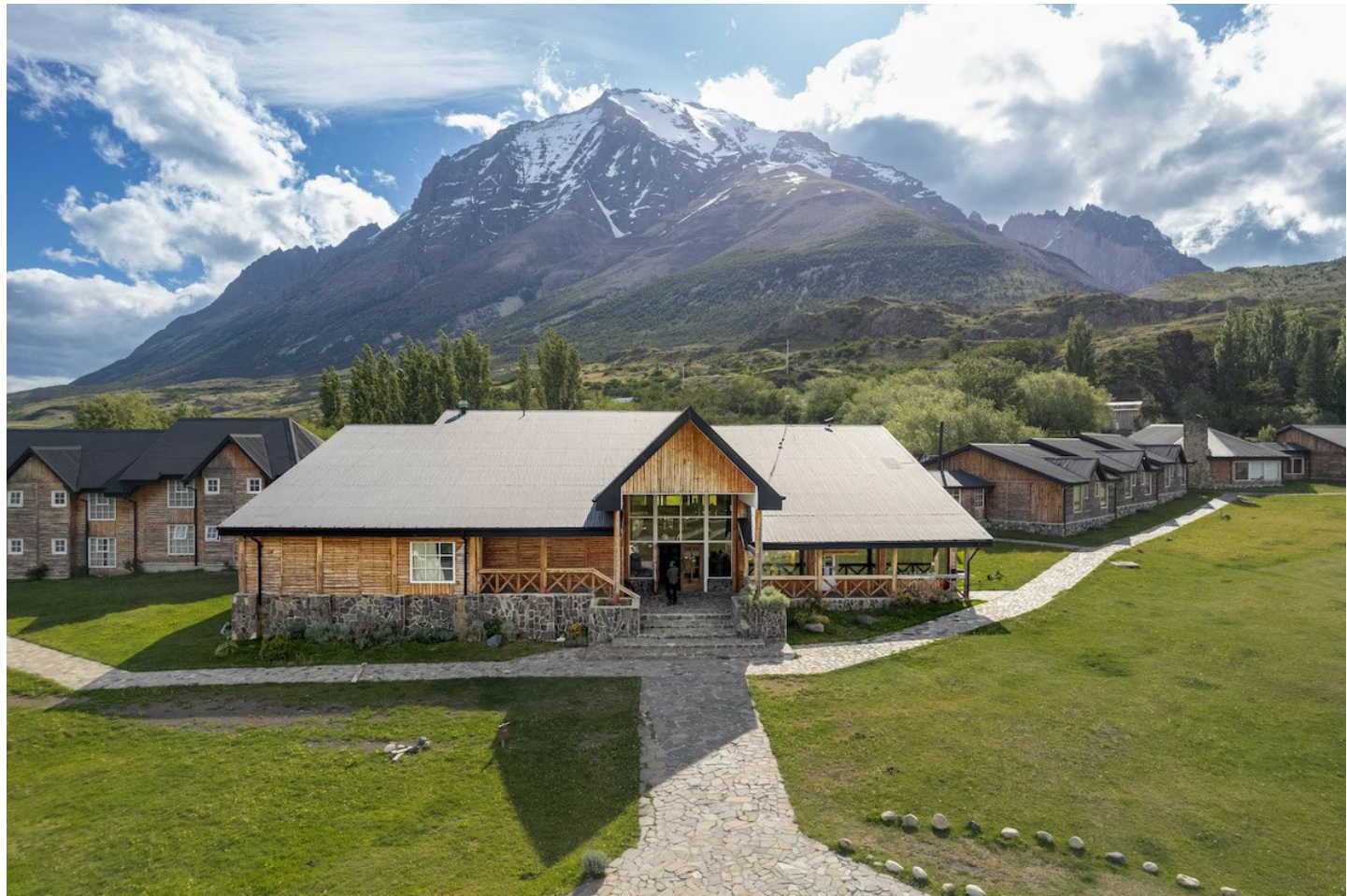
Torres del Paine

Die ehemalige Estancia ist optimal gelegen. Das gepflegte rustikale Haus bietet nebst den konventionellen auch sepezielle Ausflüge an.