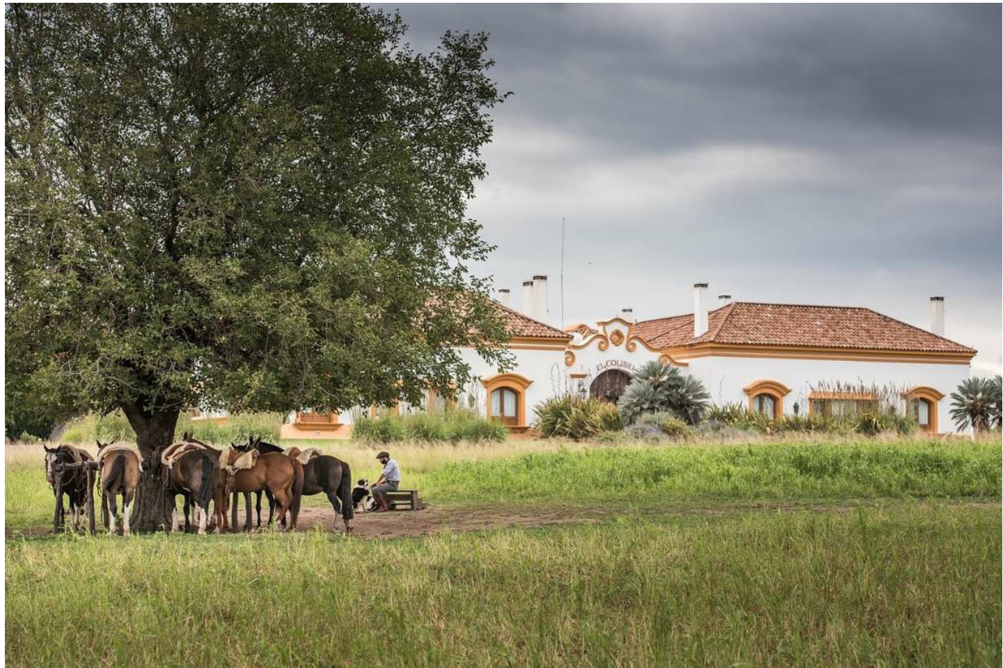
Córdoba | Santa Catalina

Ruhesuchende werden die Stille und Natur der argentinischen Pampa genießen.