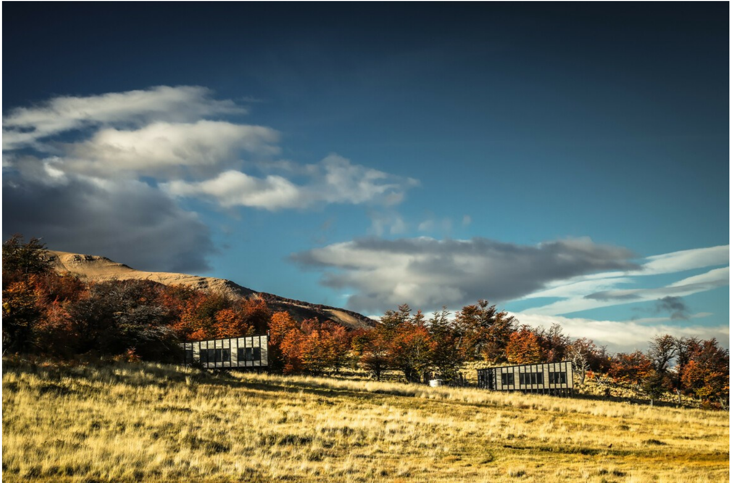
Torres del Paine

Das luxuriöse Awasi Patagonia liegt am östlichen Rand des Torres-del-Paine-Nationalparks, perfekt eingebettet in die Natur.