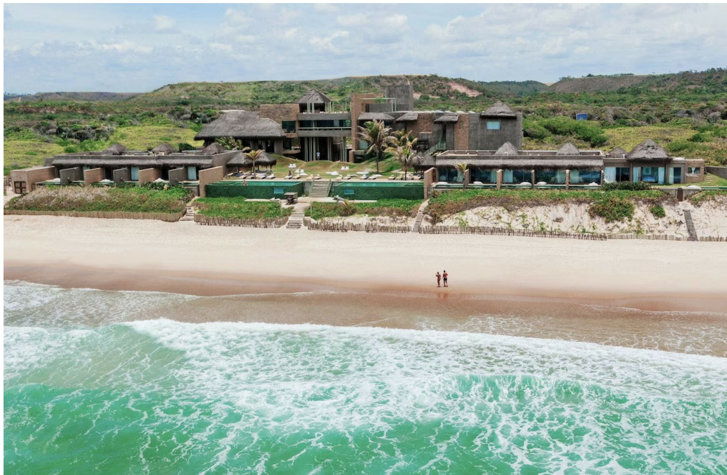
Barra de São Miguel

Exklusives Designhotel für einen traumhaften, ruhigen Strandurlaub mit viel Privatsphäre.