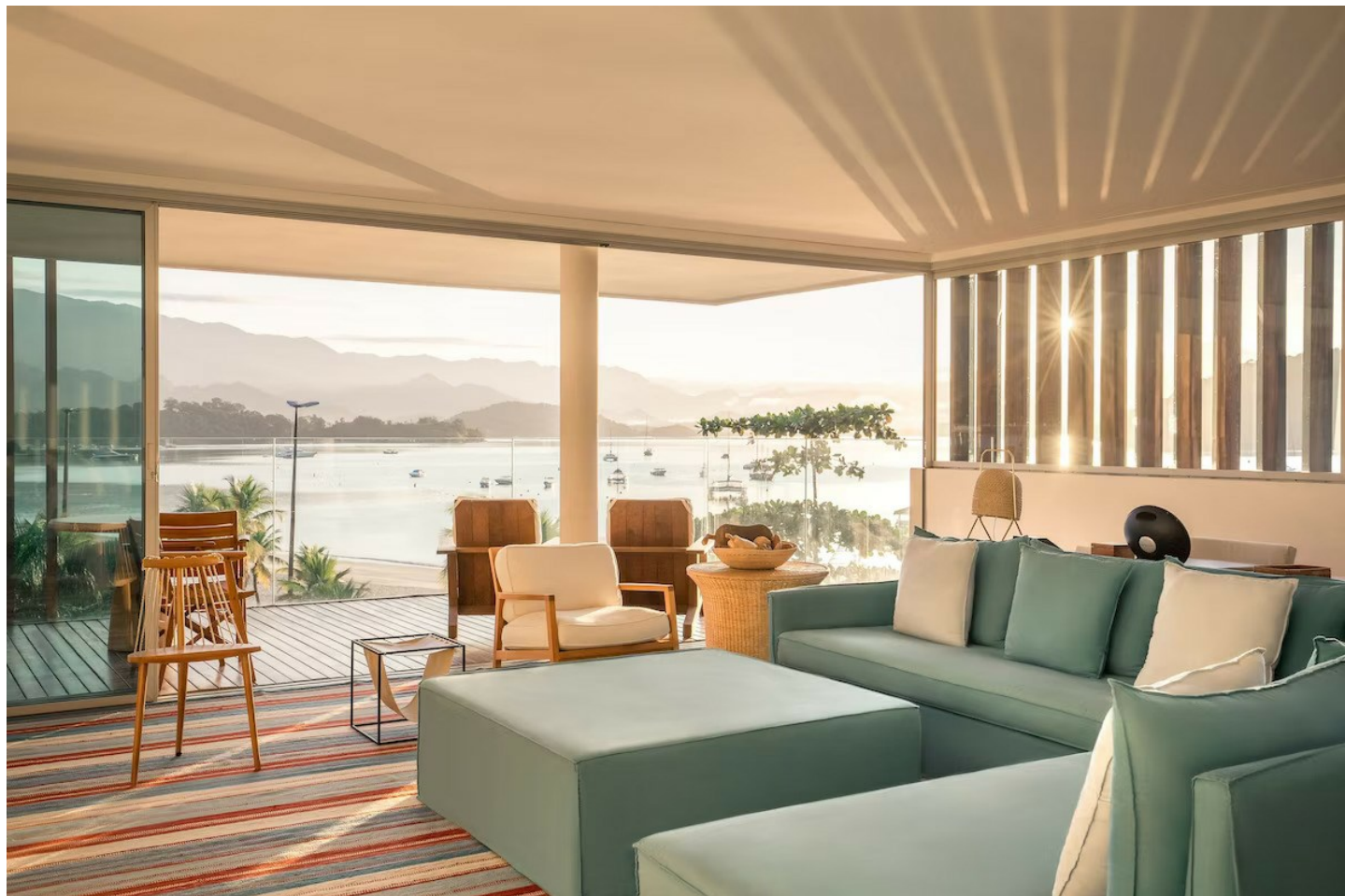
Angra dos Reis

Geniesser freuen sich über den exzellenten Service, den Pool mit herrlicher Aussicht und den über 2000 m2 grossen Spa-Bereich.