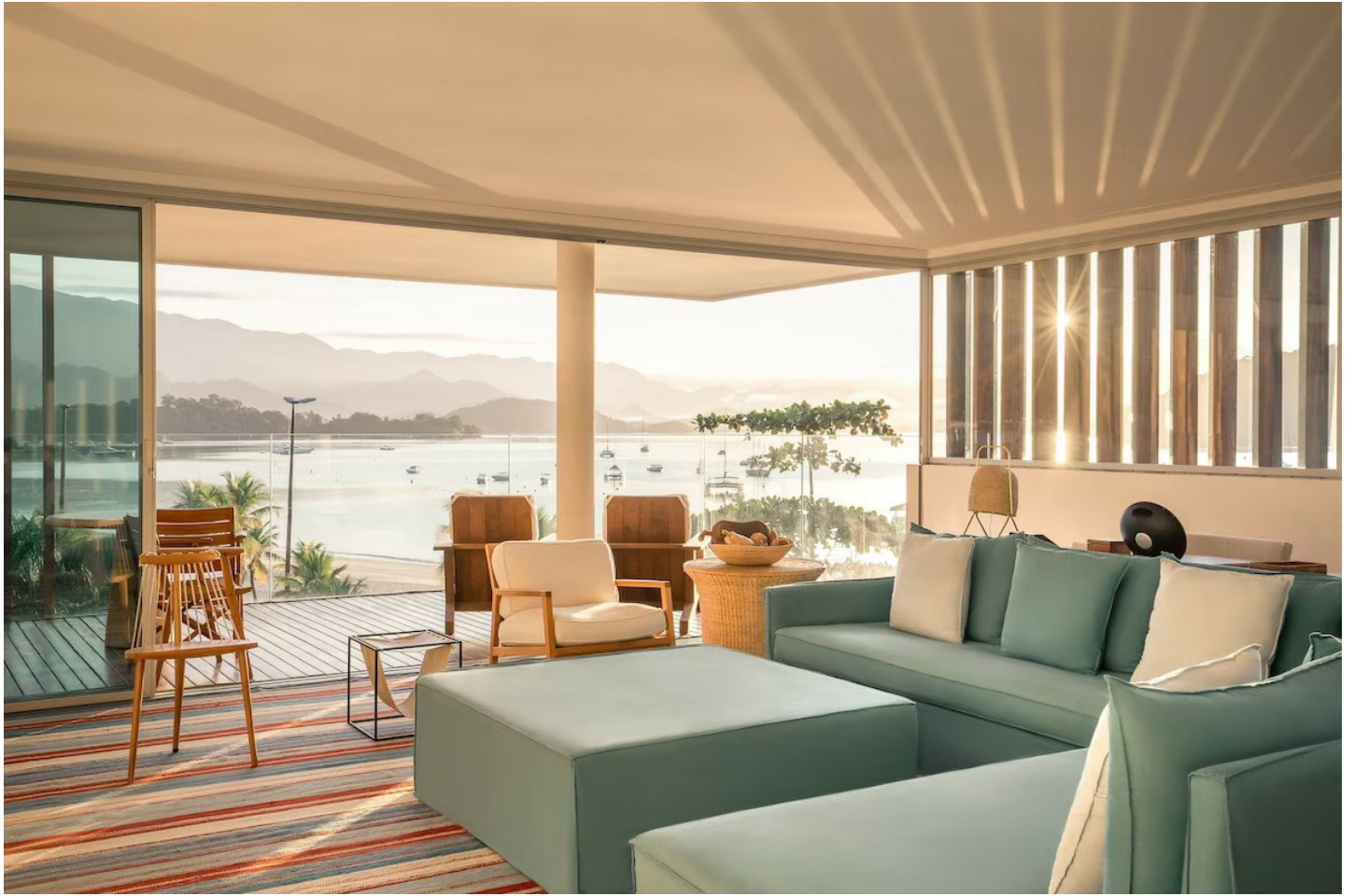
Angra dos Reis

Geniesser freuen sich über den exzellenten Service, den Pool mit herrlicher Aussicht und den über 2000 m2 grossen Spa-Bereich.