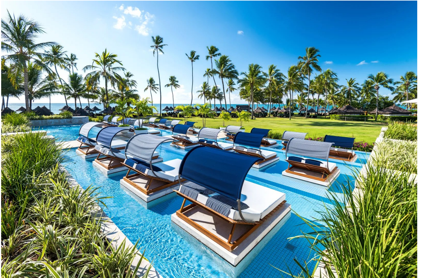
Praia do Forte

Eines der besten Resorts in ganz Brasilien. Ein idyllischer Ort und eine komfortable Anlage, welche besonderen Wert auf den Ökotourismus legt.