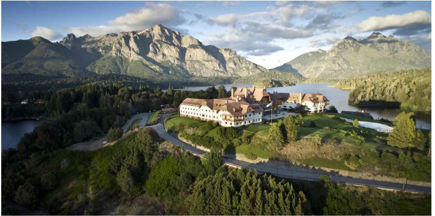
Das herrschaftliche Resort gehört zu den «Leading Hotels of the World», die Lage am tiefblauen Lago Nahuel Huapi ist spektakulär.