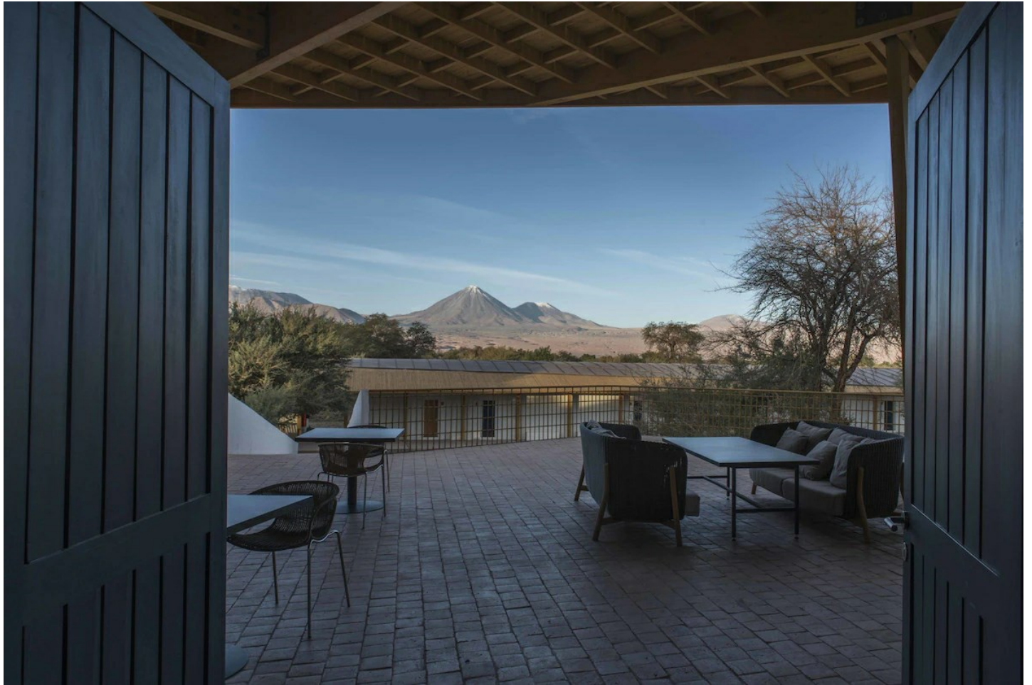
San Pedro de Atacama

Das optimal in die Landschaft eingebettete Hotel besticht durch seine attraktive Architektur.