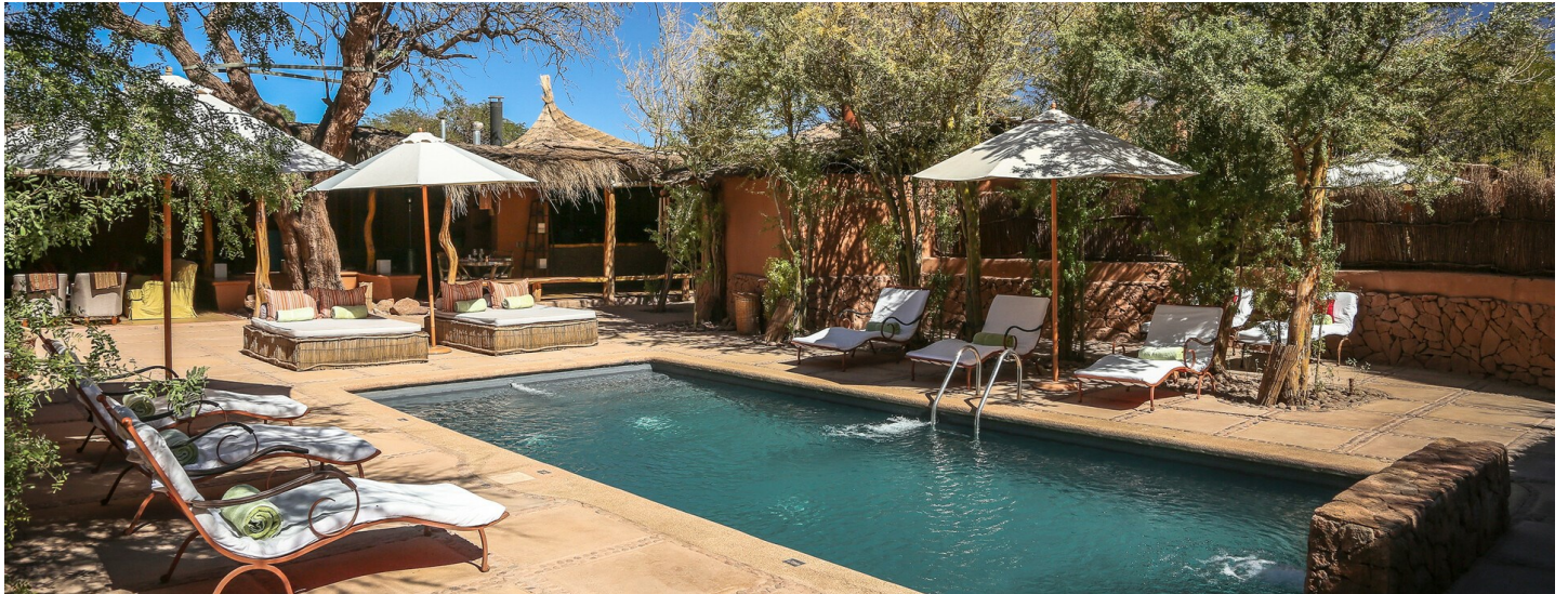
San Pedro de Atacama

Das einzigartige Bijou bietet dem Gast einen unvergesslichen Aufenthalt, es ist unmöglich, einen schöneren Ort zu finden – überzeugen Sie sich selbst!