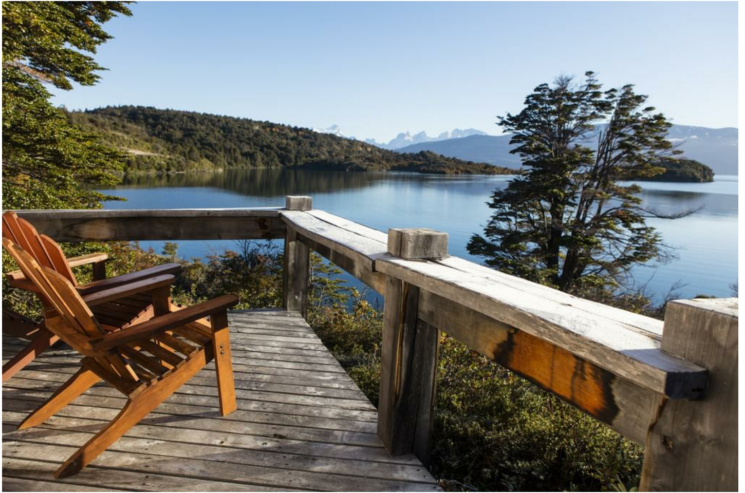
Torres del Paine

Das Camp ist das speziellste seiner Art am Rande des Nationalparks, es bietet alle Annehmlichkeiten kombiniert mit nachhaltigen und naturnahen Tourismus.