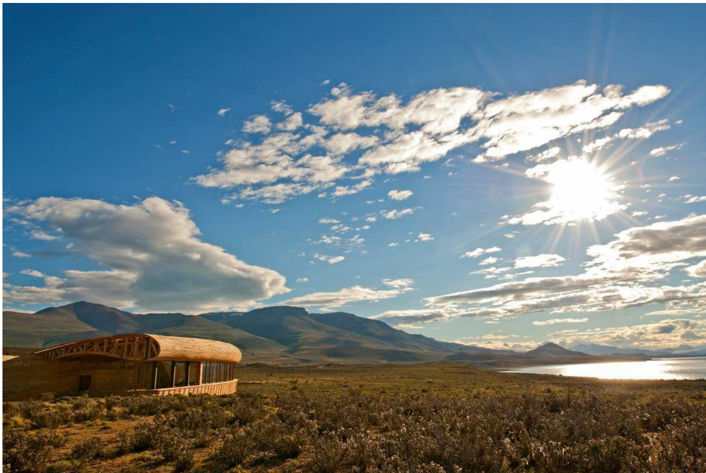
Torres del Paine

Mitten in der Natur und dennoch nicht auf Komfort verzichten? Im Luxushotel Tierra Patagonia können Sie die Seele baumeln lassen.