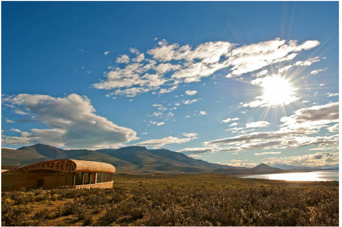
Torres del Paine

Mitten in der Natur und dennoch nicht auf Komfort verzichten? Im Luxushotel Tierra Patagonia können Sie die Seele baumeln lassen.